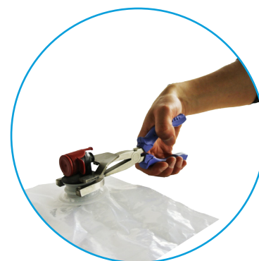
Appuyez jusqu'à l'encapsulation totale du robinet Vitop à l'intérieur du goulot